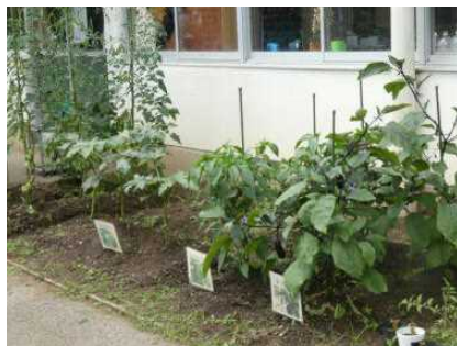
2年生の栽培している野菜 トマト、ナス、オクラです。