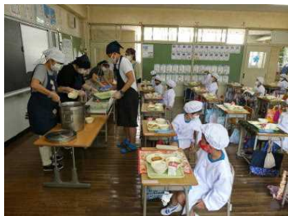
先生方で給食の準備と配膳を行いました。