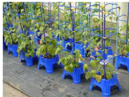
1年生の栽培している アサガオです。