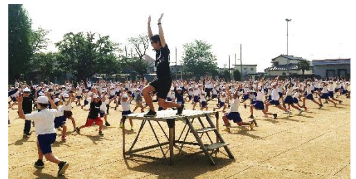
〔体育集会の様子（跳ぶ・伸ばす）〕

★北小学校ホームページもご覧ください。 http://www.oizumi-school.ed.jp/kita-e/index2.htm 「学校活動」のコーナーでは、学校行事の様子等について随時更新しております。