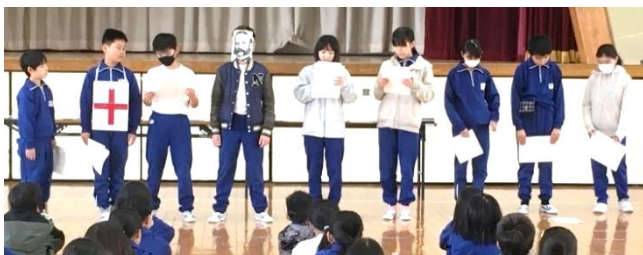
〔JRC委員の説明の様子〕