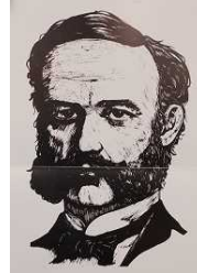
(アンリ・デュナン)

5/18 4年生以上の各クラスごとに、JRC登録式を行いました。南小ではJRC活動として、一円玉募金やアルミ缶回収などを行っていきます。その他にJRC活動の目標の一つである「奉仕」の心をもって、日々生活できるといいですね。