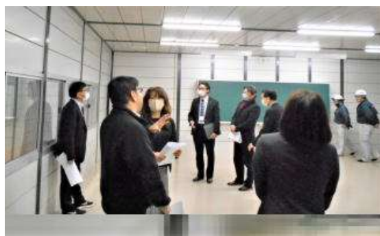
<仮設教室の視察の様子>

今回の引っ越しは、子供たちも頑張って荷物を運んでくれたので、PTA ボランティアは募りませんでしたが、今後も引っ越し作業が繰り返される予定です。大がかりな引っ越しの時にはまたご協力をお願いいたします。