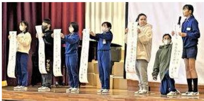
<人権標語の発表の様子>

12月7日に、体育館で人権集会を開きました。まず、全員で校歌を歌い愛校心を高めました。そして、児童会本部役員の子供たちが台本を考えた劇を上映し、本部役員が人権の大切さを訴えてくれました。次に4年生以上の代表者の人権標語を読み上げ、また、保健委員児童からレッドリボン活動の紹介がありました。最後に「翼をください」を心一つにして全員で歌いました。子供たちが作り上げた心温まる会になりました。