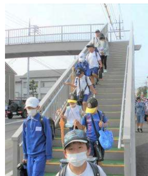
< 新しい歩道橋で >

学校前の歩道橋の工事がようやく終わり、5月19日から元の通学路で登校できるようになりました。新しい歩道橋を通った子供たちは「新しくきれいで、気持ち良く登校できます」と嬉しそうに話してくれました。登下校の見守りについて、地域の皆様、保護者の皆様には大変お世話になりました、ありがとうございました。