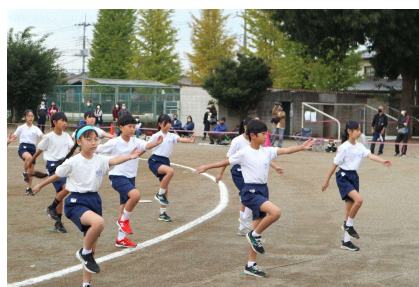
< 去年の行進の様子 >

一生懸命頑張る姿は美しい。そして、一生懸命頑張ると気持ちがいい。みんなと一緒に頑張ると特に気持ちがいい。 運動会の練習と本番を通して、そういうことをみんなに感じて欲しいです。西小のみんなが感じられたら、さらに楽しい素敵な西小になります。