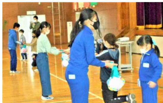
＜送る会で、6年生へプレゼントの贈呈＞

2月25日付けの通知でお知らせしたとおり、今年度の卒業式は感染症予防対応として、参列者や内容を縮小して行う予定です。縮小した中でも、できる限りの準備をして厳かで心に残る式にしたいと考えています。なお、卒業式当日の3月24日は1～5年生は出席を要しない日（お休み）となります。