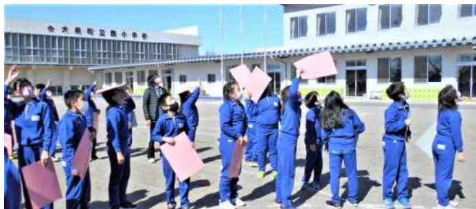
＜上空の飛行機に手を振る子供たち＞

令和2年は西小学校の開校50周年に当たり、本来なら50周年記念行事を行いたいところでしたが、この状況下でそれができませんでした。他の様々な行事も縮小・中止となった1年でしたが、子供たちにとって何か少しでも思い出になることはできないかと考え、航空写真撮影を実施しました。（通知でお伝えした通り、撮影は町内4校共通の取り組みです）