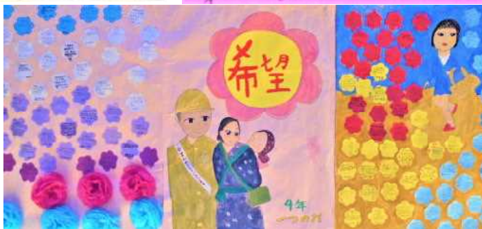
＜体育館に飾られた在校生からのメッセージ＞

新しい形でしっかり互いの思いを交流し、伝統を引き継いで行くことができたと思います。