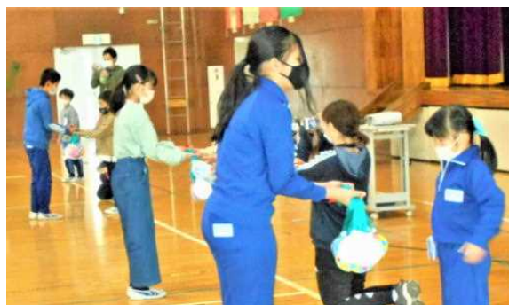
Entrega dos presentes para a 6a. série