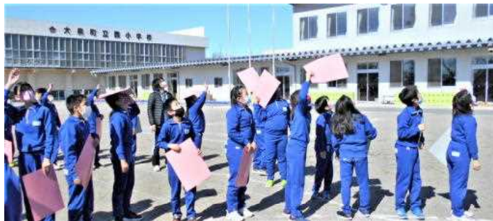
Os alunos acenando para o avião

No dia 17 de fevereiro, os alunos tiraram uma foto por série do 2o. andar da escola e no dia 19 de fevereiro montamos o desenho do brasão da escola e da [amabie] com cartões coloridos no campo da escola. O avião passou para tirar fotos dos desenhos e os alunos ficaram muito eufóricos, acenando para o avião o tempo todo. Tenho certeza que esta foto ficará guardada na memória de todos !