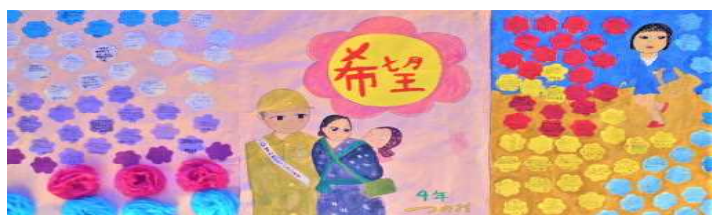
A decoração e as mensagens dos alunos